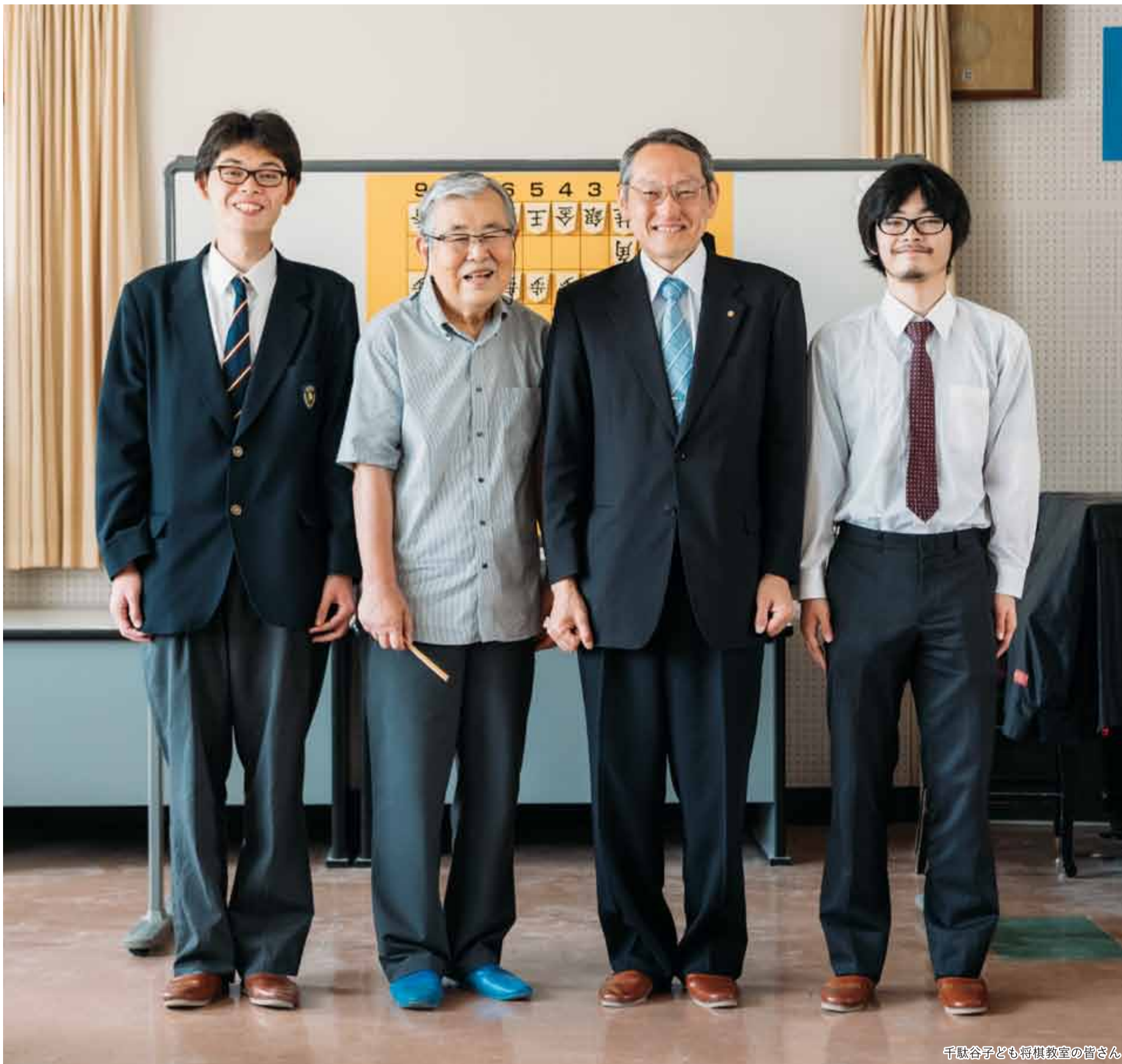
千駄谷子ども将棋教室の皆さん

発行 | 渋谷区 編集 | 広報コミュニケーション課 住所 | 〒150-8010 渋谷1-18-21 電話 | 03-3463-1211 (代表) 公式HP | www.city.shibuya.tokyo.jp/ 公式Twitter | @city_shibuya