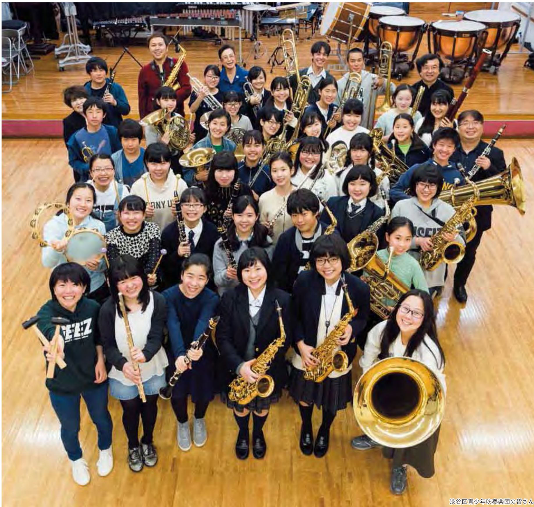
渋谷区青少年吹奏楽団の皆さん

発行 | 渋谷区 編集 | 広報コミュニケーション課 住所 | 〒150-8010 渋谷1-18-21 電話 | 03-3463-1211 (代表) 公式HP | www.city.shibuya.tokyo.jp/ 公式Twitter | @city_shibuya