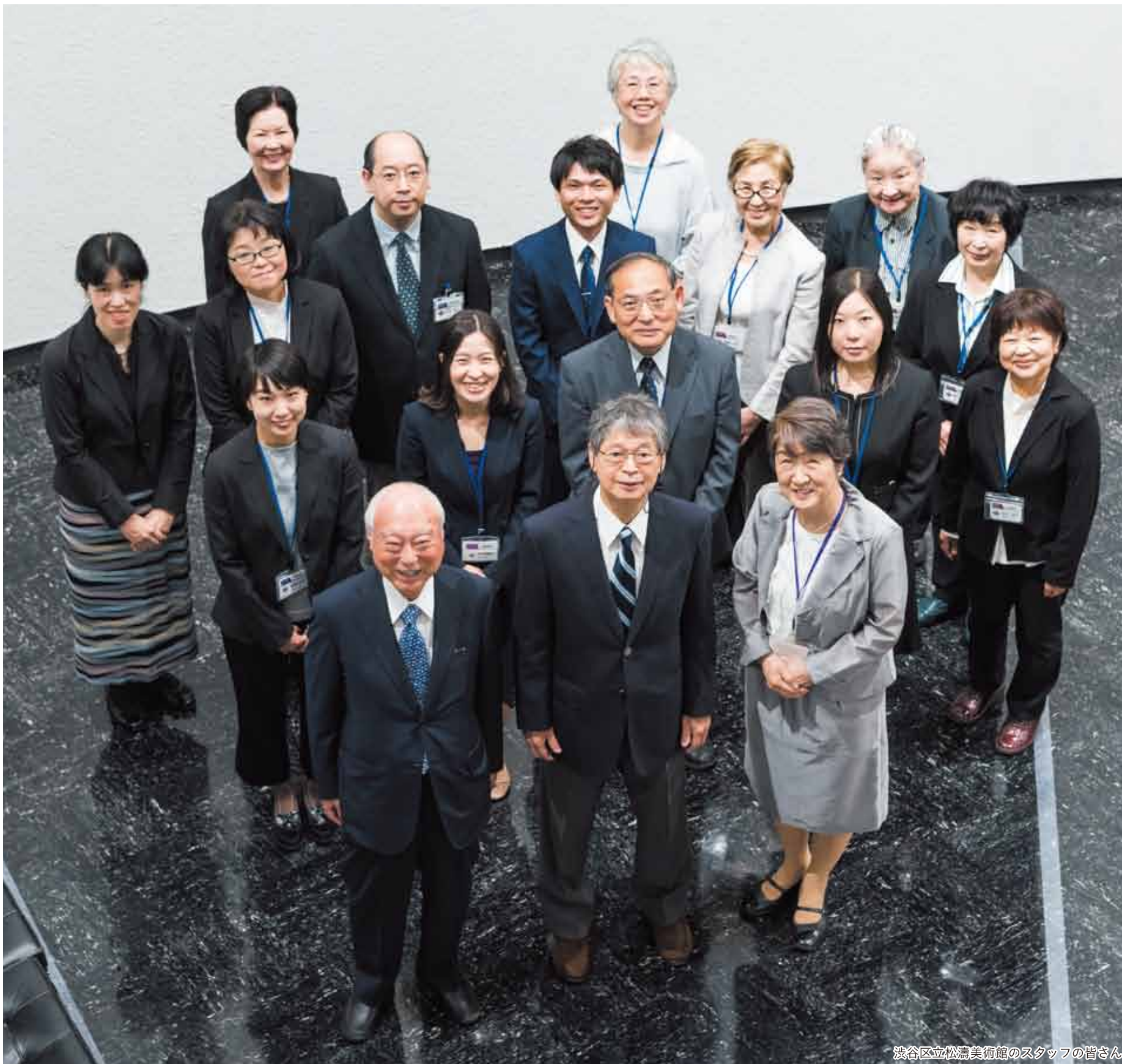
渋谷区立松濤美術館のスタッフの皆さん

発行 | 渋谷区 編集 | 広報コミュニケーション課 住所 | 〒150-8010 渋谷1-18-21 電話 | 03-3463-1211 (代表) 公式HP | www.city.shibuya.tokyo.jp/ 公式Twitter | @city_shibuya