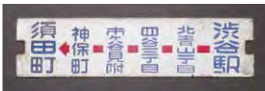
▲昭和40年代 都電行き先板