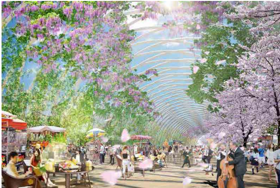
※多目的広場イメージ