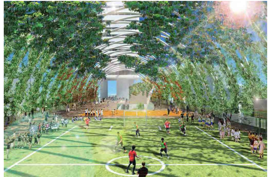
※運動施設イメージ