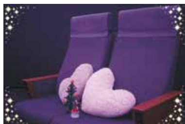
▶カップルシート1セット1500円あり