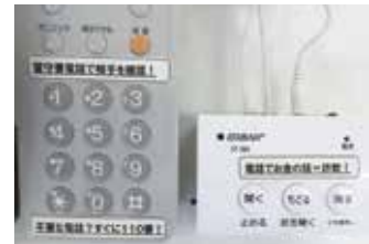
▲自動通話録音機を設置した電話

被害に遭わないためには、事前の対策が重要です。区では、区内の警察署を通じて、自動通話録音機を無料で貸し出しています。