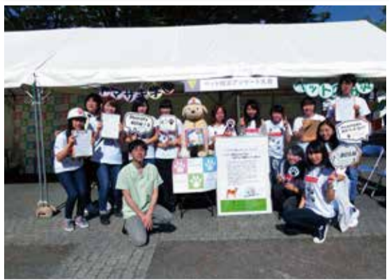
▲「渋谷防災フェス」当日の様子