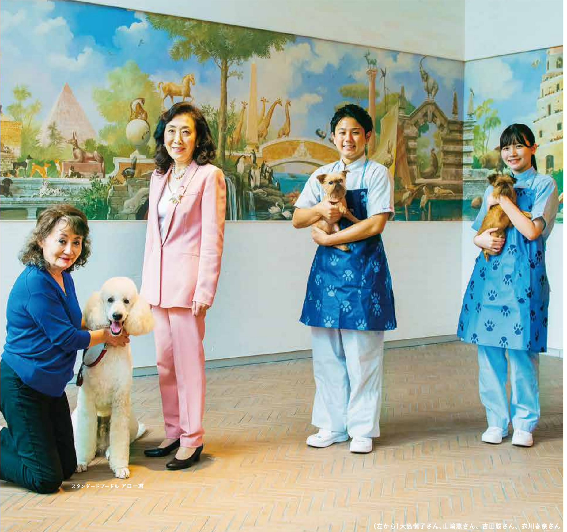
スタンダードプードル アロー君

発行 | 渋谷区 編集 | 広報コミュニケーション課 所在地 | 〒150-8010 宇田川町1-1 電話 | 03-3463-1211 (代表) HP | www.city.shibuya.tokyo.jp/ Twitter | @city_shibuya Facebook | @shibuya.city Instagram | @city_shibuya_official LINE | @shibuyacity