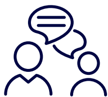
業務中の会話や接触