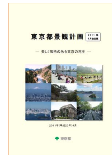
東京都景観計画 特定区域景観形成指針