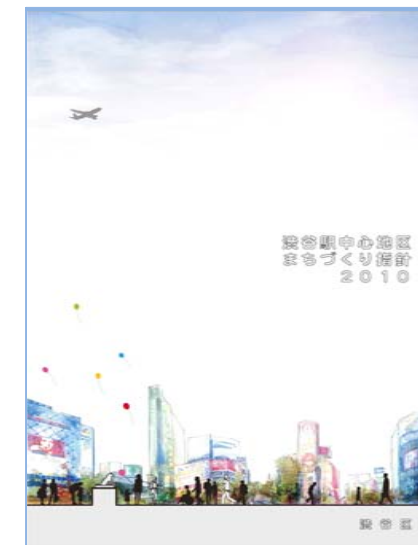
渋谷駅中心地区まちづくり指針 2010

これらを実施する為、デザイン会議で確認を行うとともに、周辺地域との調和・連携について指導・助言・調整を行う。