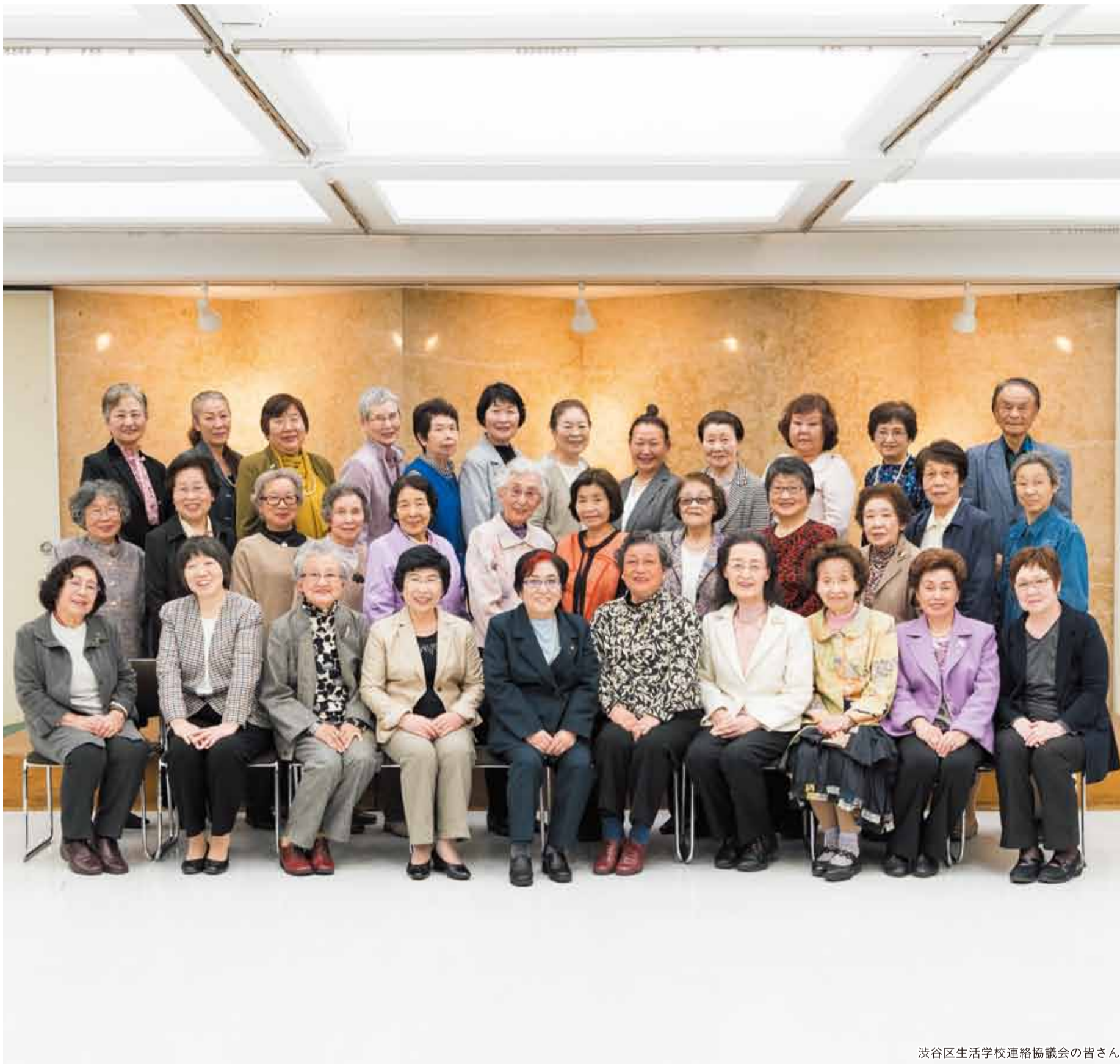
渋谷区生活学校連絡協議会の皆さん

発行 | 渋谷区 編集 | 広報コミュニケーション課 住所 | 〒150-8010 渋谷1-18-21 電話 | 03-3463-1211 (代表) 公式HP | www.city.shibuya.tokyo.jp/ 公式Twitter | @city_shibuya