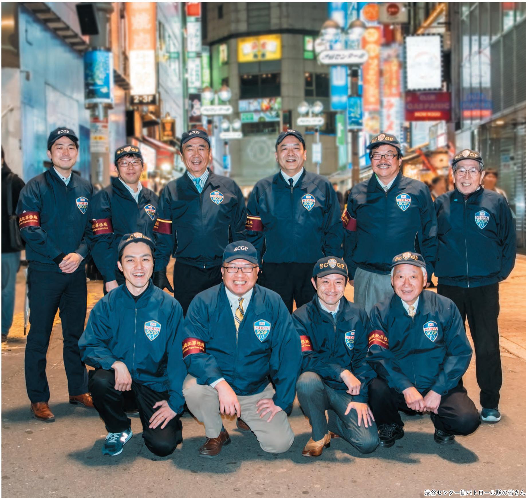
渋谷センター街パトロール隊の皆さん

発行 | 渋谷区 編集 | 広報コミュニケーション課 住所 | 〒150-8010 渋谷1-18-21 電話 | 03-3463-1211 (代表) 公式HP | www.city.shibuya.tokyo.jp/ 公式Twitter | @city_shibuya