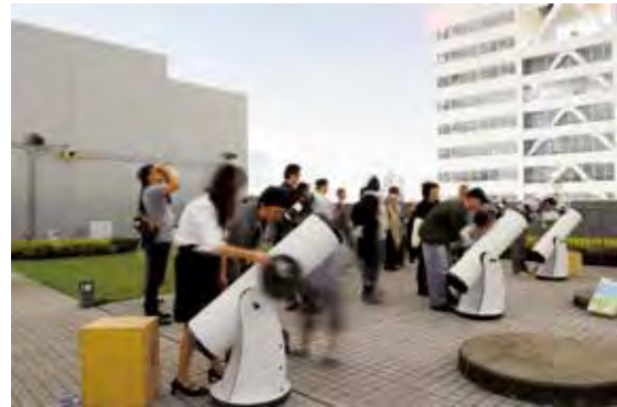
用コスモプラネタリウム渋谷 (☎3464-2131 FAX3464-2148)

回5月29日(月)19:30~21:00 場文化総合センター大和田12階 内容 星空解説後、望遠鏡で、細長い月と木星、春の星を観望 ※悪天候の場合はプラネタリウム投影 対象 在住・在勤・在学の人(小学生は保護者同伴) 定40人(抽選) 用5月20日20:00(必着)までにファクス・往復ハガキで(8ページ)記入例(参加者全員分)のほかファクス番号、〒150-0031桜丘町23-21文化総合センター大和田内 コスモプラネタリウム渋谷へ ※1通につき4人まで