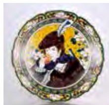
▲木村了子「九谷の王子さま-白椿王子」 2013年作家蔵