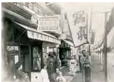
▲大正11年 現在の明治通り氷川神社前付近