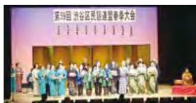
▲今年で60回目の開催となります

日 4月16日(日) 時間 10:00開演(9:30開場) 場 文化総合センター 大和田6階 伝承ホール 内容 民謡と三味線・尺八・胡弓などの演奏 申込 当日会場 問い合わせ 文化振興課交流推進係 (☎3463-1142 ☎3464-3406)