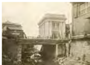
▲大正11年頃 渋谷川と宮益橋

農村だった頃の名残りが至るところでみられた、明治・大正時代の渋谷の写真を紹介します。