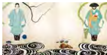
▲山本太郎「隅田川 桜川」2010年、紙本着色燻銀彩、二曲一雙、各169.0×167.0cm、個人蔵 ©Taro YAMAMOTO, courtesy of imura art gallery