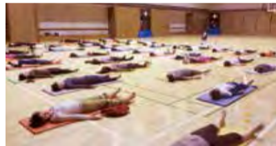
◀ 深い呼吸とポーズで心身ともにリフレッシュしましょう

回 4月13日~30年3月29日の(木)19:15~20:30 ※5月4日、11月23日、12月28日、1月4日を除く 場 文化総合センター大和田地下1階多目的アリーナ ☑ 在住・在勤・在学の人(小学生は保護者同伴) 定 各40人(先着) 費 1回500円 持 運動できる服装 申 当日19:00~19:30に会場