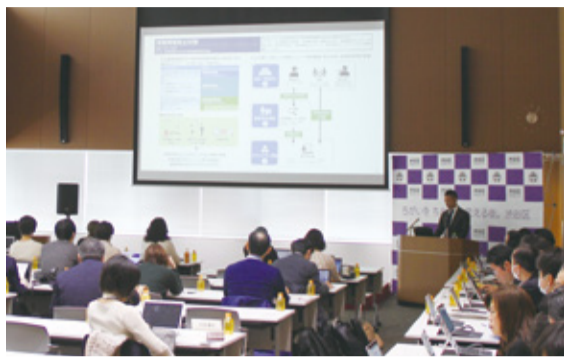
◀2月3日 令和2年度 渋谷区当初予算案 記者会見

区は「ちがいを ちからに 変える街。渋谷区」のフレーズのもと、その原動力となる「ダイバーシティ&インクルージョン※」を理念として、本区が持続的成長を遂げていくため、未来への投資を強く意識した予算案を発表しました。 ※多様性を受け入れ、エネルギーへと変えていくこと