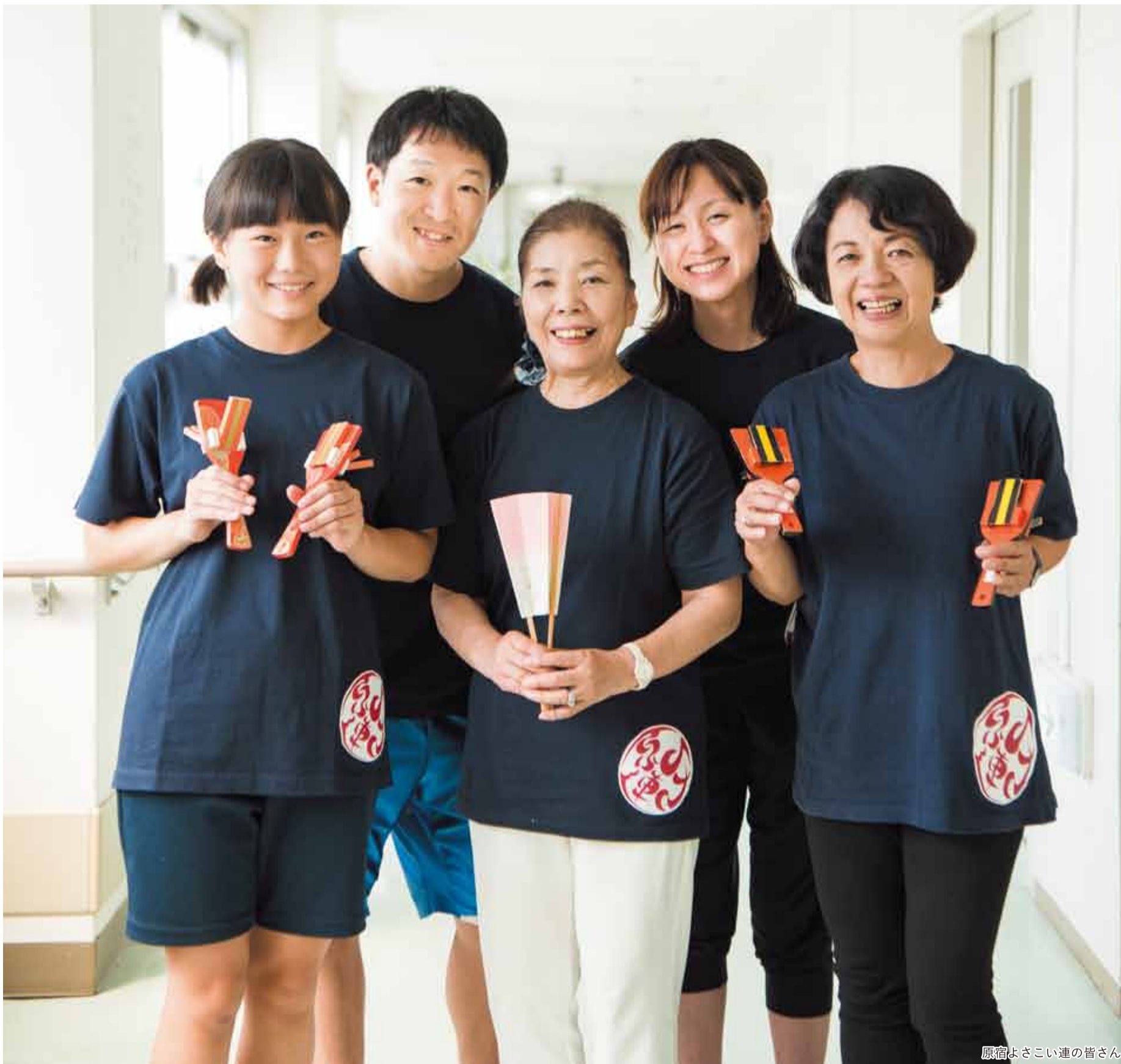
原宿よさこい連の皆さん

発行 | 渋谷区 編集 | 広報コミュニケーション課 住所 | 〒150-8010 渋谷1-18-21 電話 | 03-3463-1211 (代表) 公式HP | www.city.shibuya.tokyo.jp/ 公式Twitter | @city_shibuya