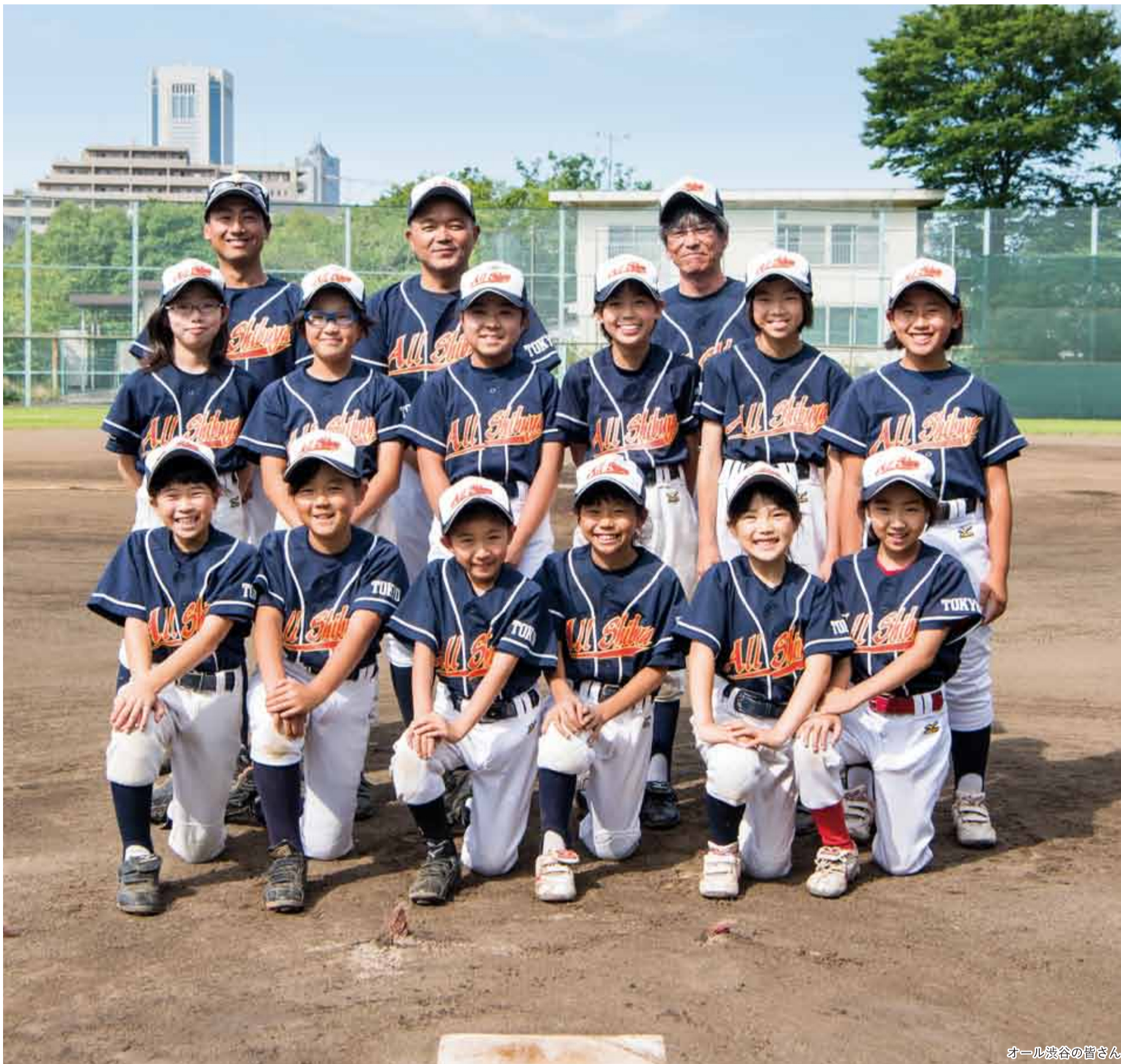
オール渋谷の皆さん

発行 | 渋谷区 編集 | 広報コミュニケーション課 住所 | 〒150-8010 渋谷1-18-21 電話 | 03-3463-1211 (代表) 公式HP | www.city.shibuya.tokyo.jp/ 公式Twitter | @city_shibuya