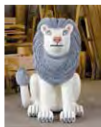
▲三沢厚彦「Animal 2016-01」

回10月7日(出)~11月26日(日) ・ギャラリートーク 回10月20日(金)14:00から 定40人(先着) 回当日会場