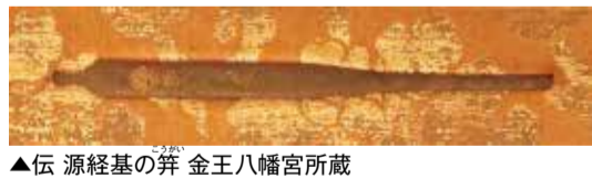
▲伝 源経基の薙 金王八幡宮所蔵

◎企画展「渋谷に残された伝説」 開1月13日(月・祝)まで 因源氏の武将や渋谷金丸をはじめとする渋谷の伝説を絵画資料などで紹介