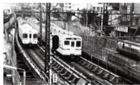
▲昭和58年 地下化工事中の 初台一丁目付近

回6月16日(土)~ 8月5日(日) 因工事中の沿線や地上 駅時代の幡ヶ谷駅の写 真など