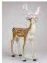
▲三沢厚彦「Animal 2004-04」

●展覧会「三沢厚彦 アニマルハウス 謎の館」 回11月26日(日)まで ・学芸員によるギャラリートーク 回11月11日(土)・19日(日)14:00から 定40人(先着) ・公開制作「粘土で首像をつくる」 三沢厚彦×舟越桂 回11月18日(土)15:00~16:00 定80人(先着) ・作家集合トーク 回11月25日(土)14:00~15:00 出演三沢厚彦ほか 定80人(先着) <共通事項> 申込当日会場で